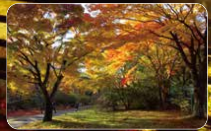
伊香保温露天風呂、県立伊香保温森林公園周辺など紅葉の名所です。

実施期間：10月25日(火)～11月13日(日)予定 点灯時間：16時30分～22時00分予定